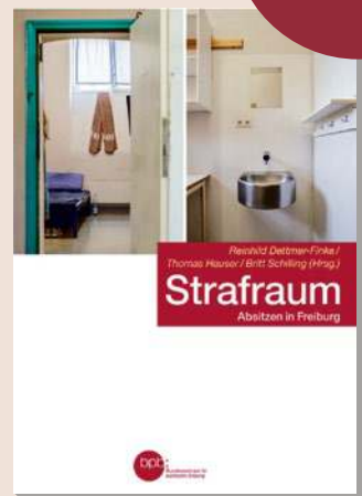
2021 Bestell-Nr. 10638