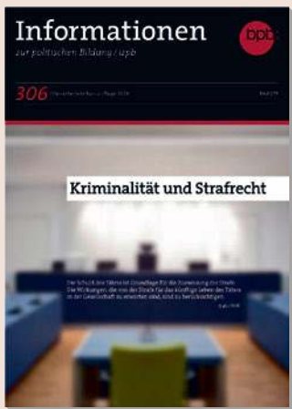
2018 Bestell-Nr. 4306