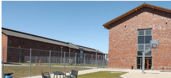
Häuser G und H (oben), Abteilung Sicherungs- verwahrung (Mitte)

Herzlich laden wir zum vierten gemeinsamen Treffen der AGs Sicherungsverwahrung der ev. und kath. Gefängnisseelsorge Deutschland ein.