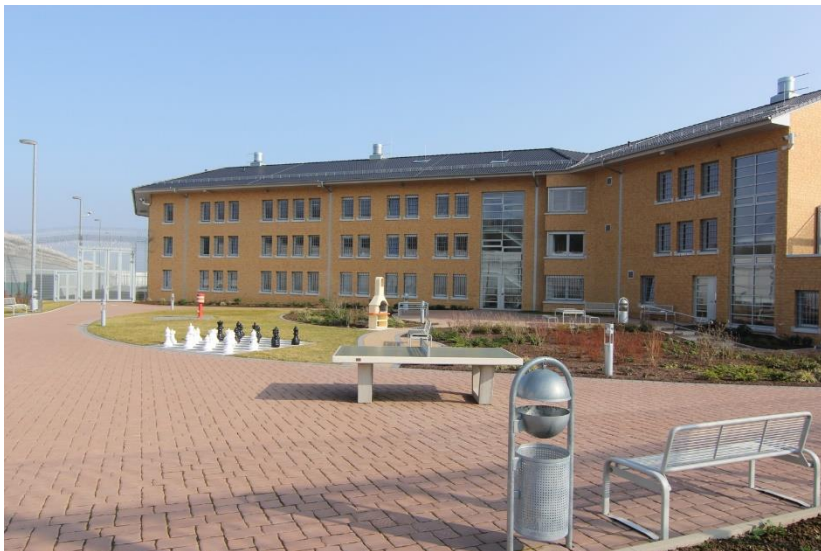
Abteilung SV der JVA Rosdorf

Herzlich laden wir zum dritten gemeinsamen Treffen der AGs Sicherungsverwahrung der ev. und kath. Gefängnisseelsorge in Deutschland ein.