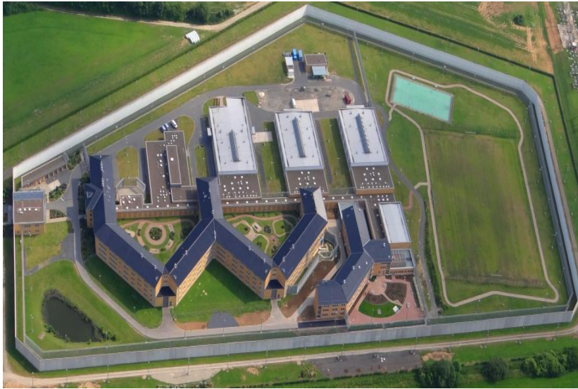
Luftbild der JVA Rosdorf, Gebäude rechts Abteilung SV