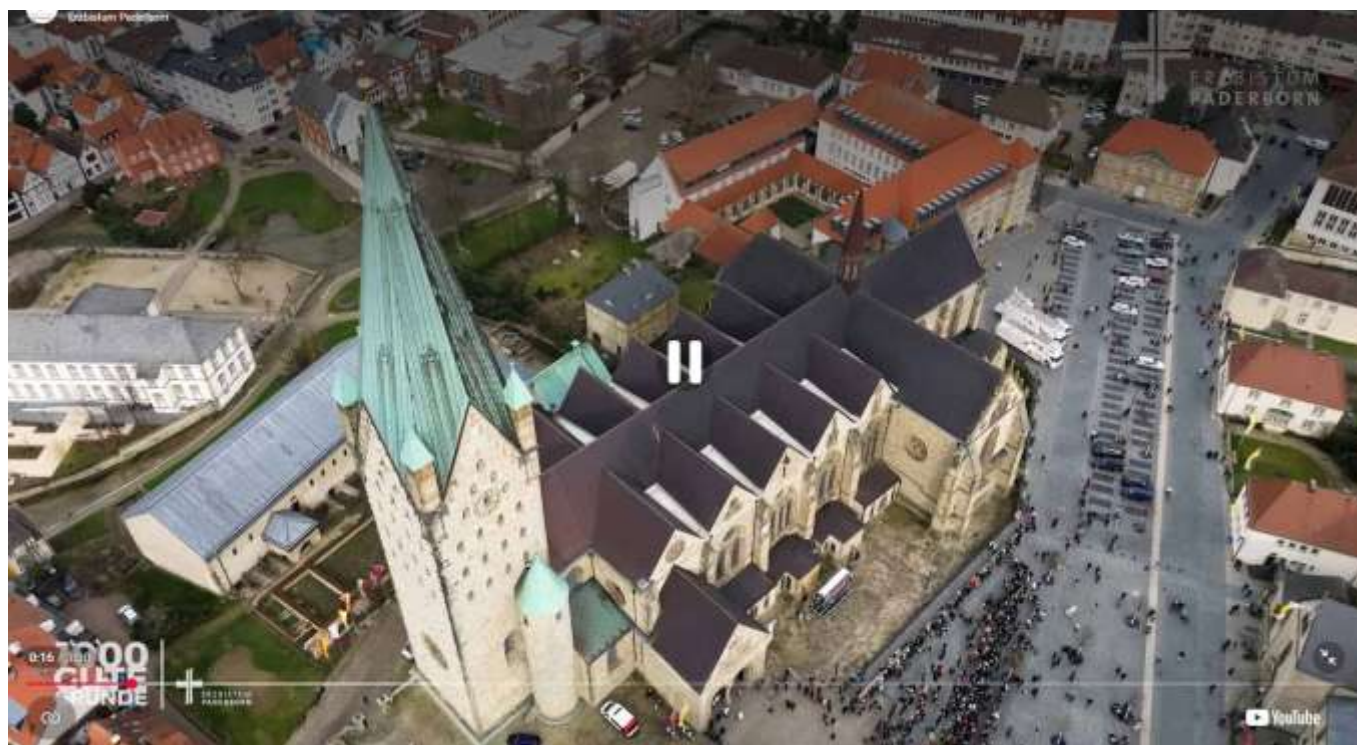
YouTube: Studientagung der Gefängnisseelsorge 2026 und Katholikentag 2028 in Paderborn.