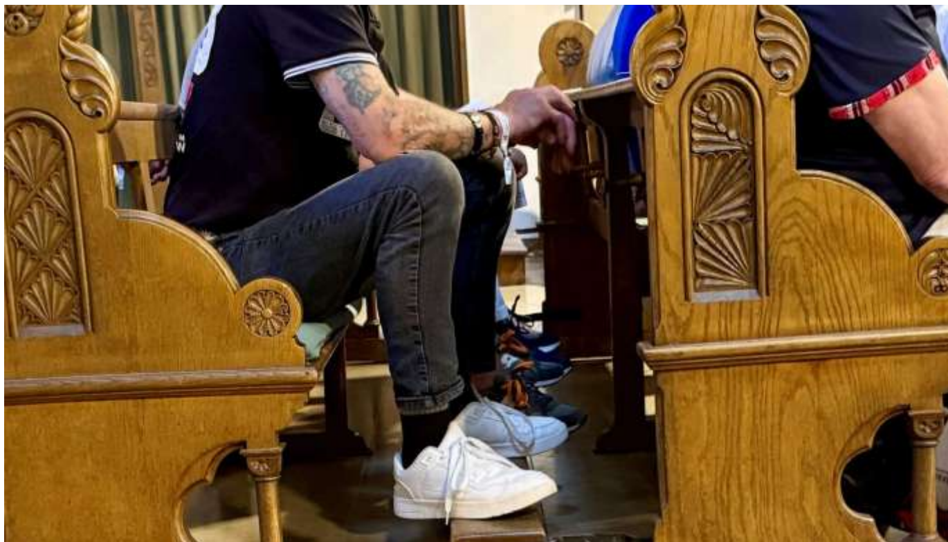
Zwischen den (Kirchen-)Stühlen?