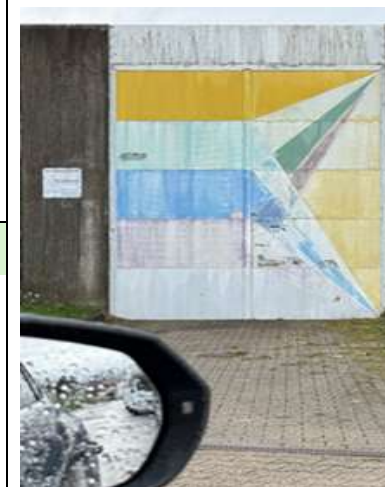
Stand: Donnerstag, 28. Mai 2026

Zu Freiheit berufen: Möglichkeiten und Grenzen im Justizvollzug Paderborn 2026