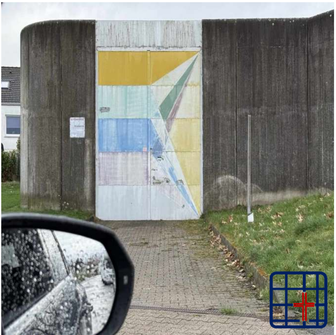
Tor und Außenmauer der ehemaligen Justizvollzugsanstalt Iserlohn.

Zur jährlichen Studientagung treffen sich GefängnisseelsorgerInnen* bundesweit für Gespräche, Weiterbildung und politischer sowie kirchlicher Positionierung an wechselnden Orten. Jeder in der Gefängnisseelsorge Tätige kann an der Tagung teilnehmen. Die Kosten hierfür übernimmt das jeweilige Land oder das Bistum vor Ort. Im Rahmen der Studientagung wird die Mitgliederversammlung der Katholischen Gefängnisseelsorge in Deutschland e.V. durchgeführt.