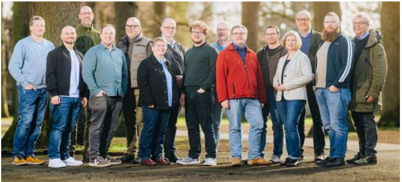
GefängnisseelsorgerInnen* auf dem Gebiet des Erzbistum Paderborn.

Herzlich Willkommen und herzliche Einladung nach Paderborn