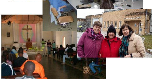
Begegnungen, Besuche und Austausch – hier mit Italien, Lettland, Brasilien und Mosambik (im Uhrzeigersinn)