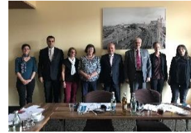
Treffen mit Delegation aus dem Libanon